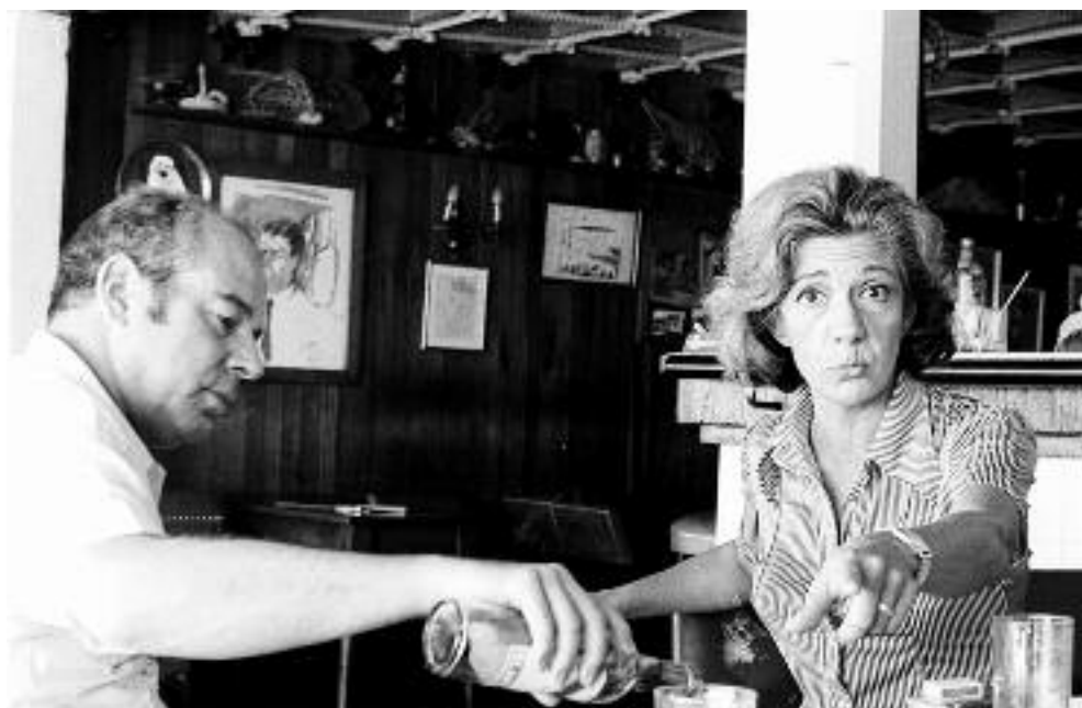
Jaime Gil de Biedma y Ana María Matute. Sitges, 1972

27,5 x 38,5 cm Tiraje: 2006 Gelatina de plata