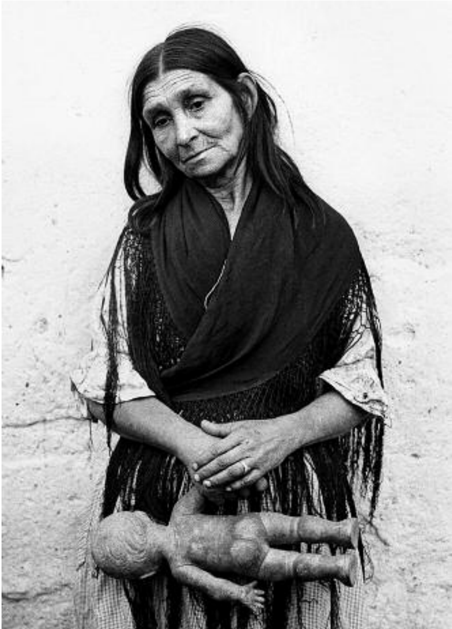
Gitana con su muñeca en Montjuich. Barcelona, 1962