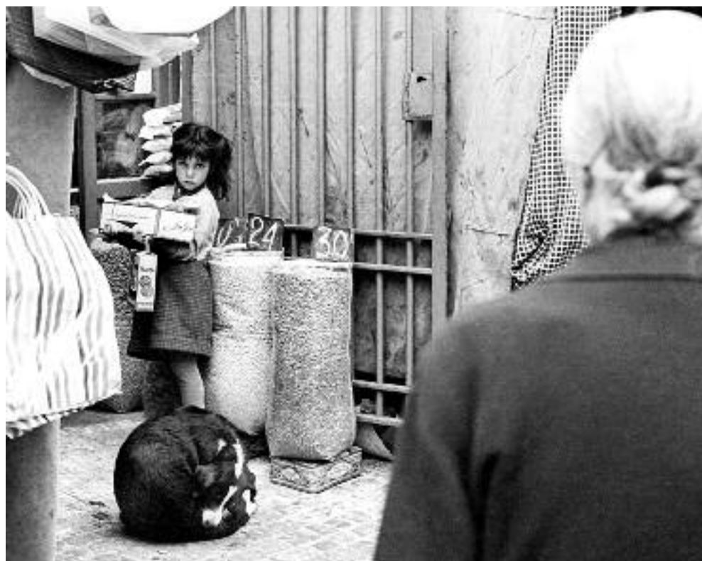
Niña en el mercado de la Barceloneta. Barcelona, 1966