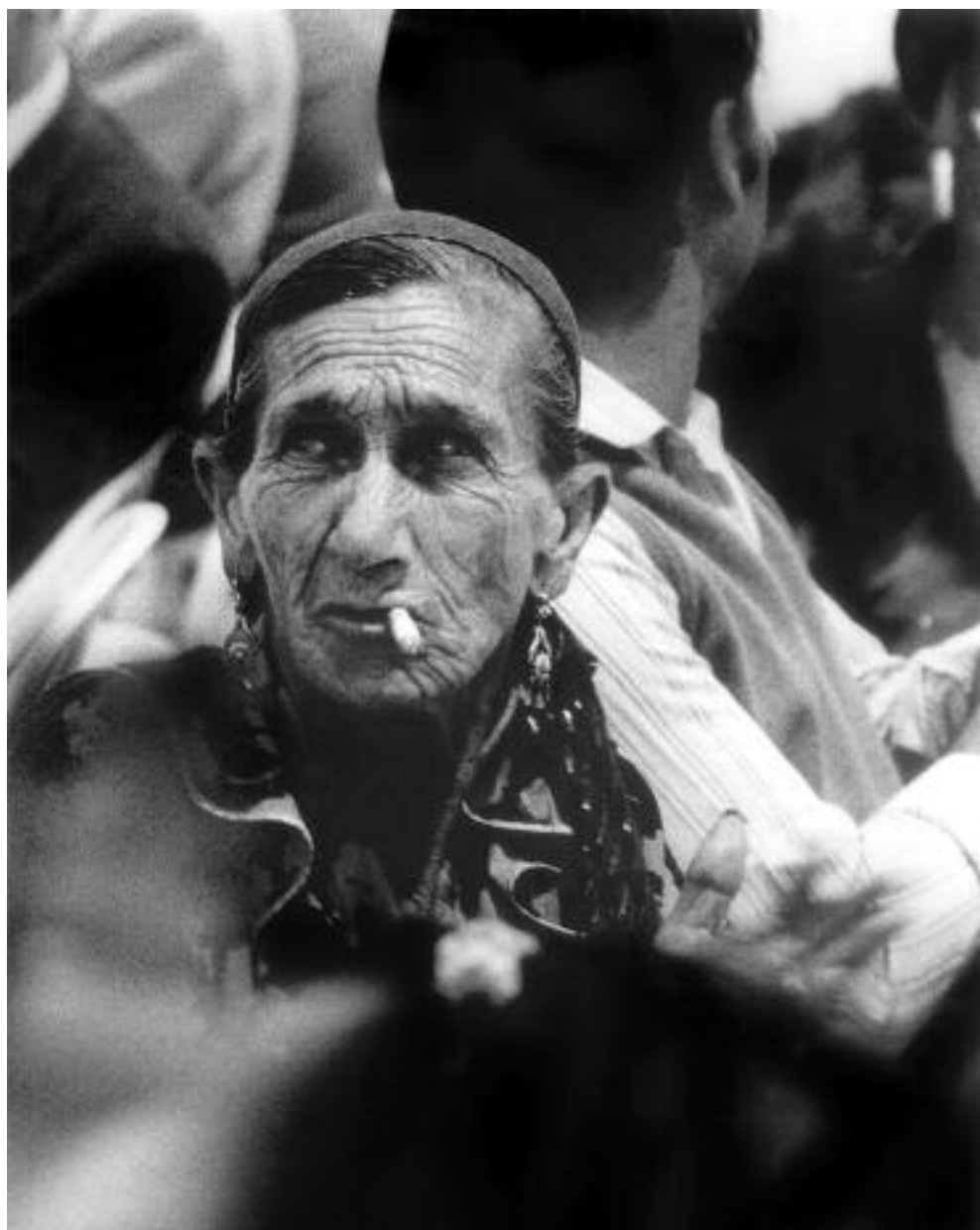
Gitana húngara. Santa Coloma, 1994