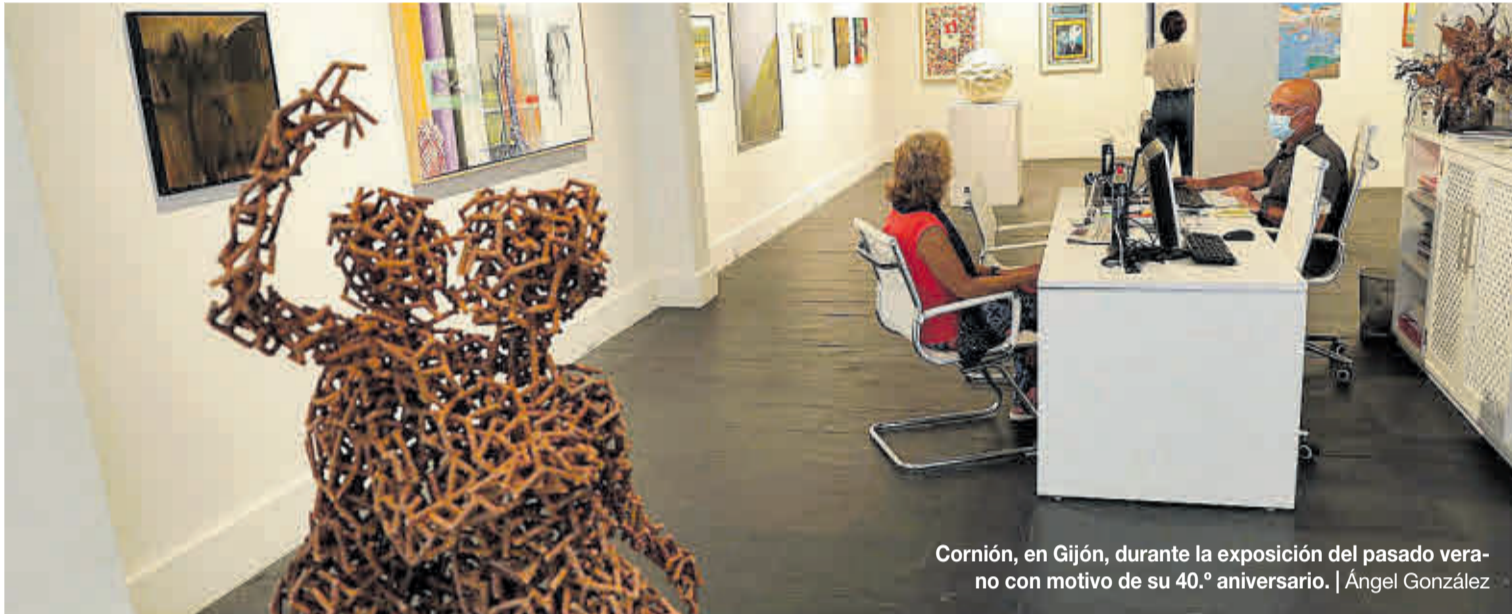
Cornión, en Gijón, durante la exposición del pasado verano con motivo de su 40.º aniversario. | Ángel González